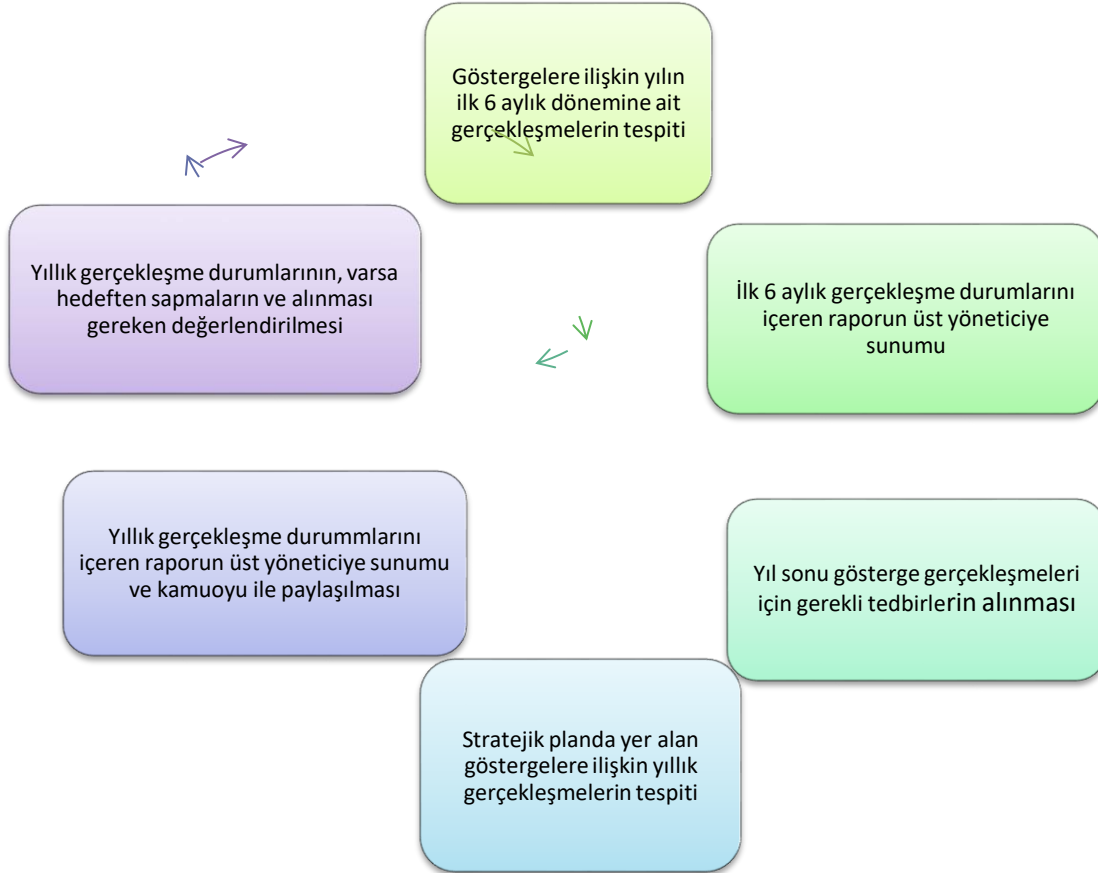
Tablo 42. İzleme ve Değerlendirme Modeli