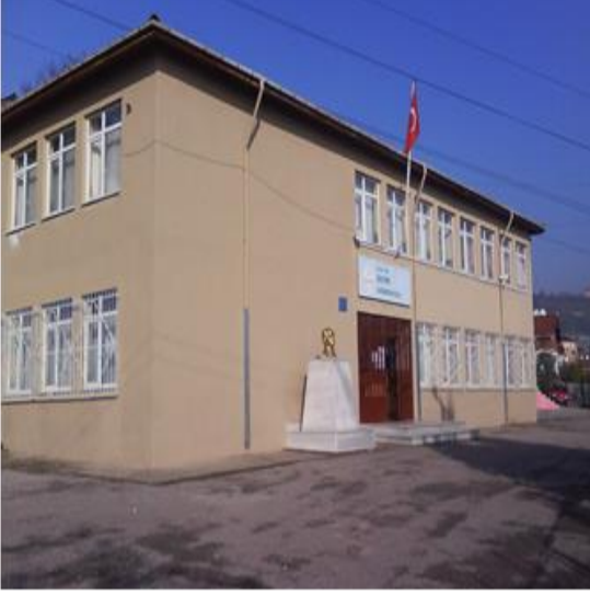
Eski Okul Binamız